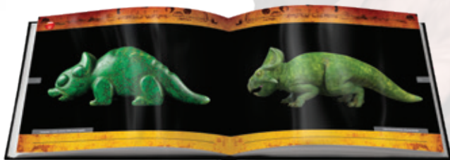
© Untold Secrets of Planet Earth: Dire Dragons

A németalföldi Hóráskönyv (kb. Kr. u. 1440) Szent Györgyöt, a hőst egy sárkánnyal küzdve ábrázolja. Abban a korban ez egy ismert állat lehetett. A sárkány méretét és alakját érdemes összevetni a lóéval! Mennyire hasonlít a triász kőzetek maradványai alapján rekonstruált hüllő a rajzon látható sárkányhoz!