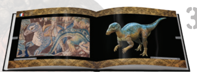
© Untold Secrets of Planet Earth: Dire Dragons

A baloldalt látható türkiz sárkány a kínai Hungshan-kultúrából való, és talán még 4000 évesnél is idősebb. A kínaiak számtalan különféle sárkányt megörökítettek, amelyek meglepően hasonlítanak a dinoszauruszok rekonstrukcióihoz. A türkiz sárkány különbözik ugyan a ma élő állatoktól, de különös hasonlóságot mutat az egyszarvú Centrosaurus szal.