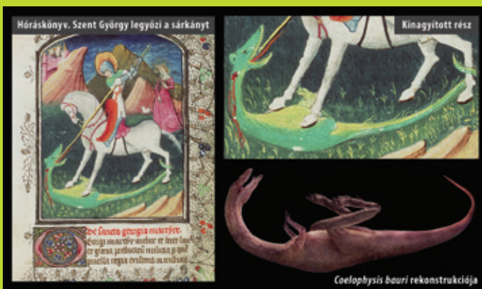
© Untold Secrets of Planet Earth: Dire Dragons

A Kr. e. 1500-as évekig széles körben használtak pecsét-hengereket Mezopotámiában, dokumentumok és küldemények személyes szignálására. A fenti pecsét négy lábon álló, hosszú nyakú, hosszú farkú különös állatokat ábrázol. Ezek feltűnően hasonlítanak a rekonstruált Tanystropheus nevű hüllőhöz, amelynek maradványai triász! kőzetekből származnak.